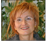
Marie Heinisch Kontakt- und Beratungsstelle Willich-Wekeln

Fon: 0 21 62 / 81 67 56 -0 c.bergmann@phg-viersen.de