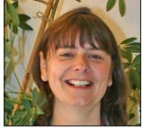
Christiane Bergmann Kontakt- und Beratungsstelle Viersen

Fon: 0 21 62 / 102 55 92 u.huelsken@ifd-kr-vie.de